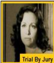
Trial By Jury