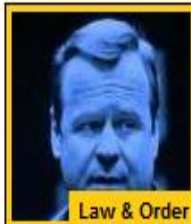
Law & Order